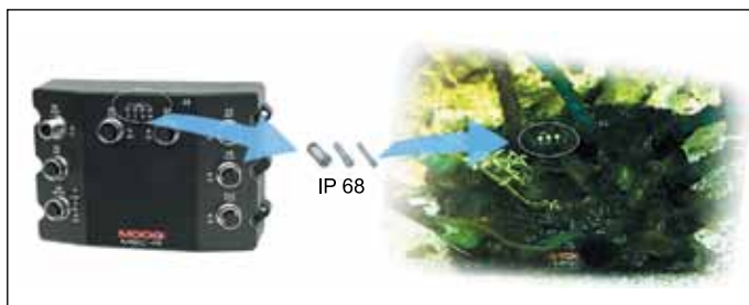
Рис. 9. Использование световода IP68 серии 1282 в промышленном сетевом модуле Moog GmbH