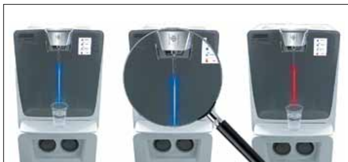
Рис. 8. Кулер Kärcher