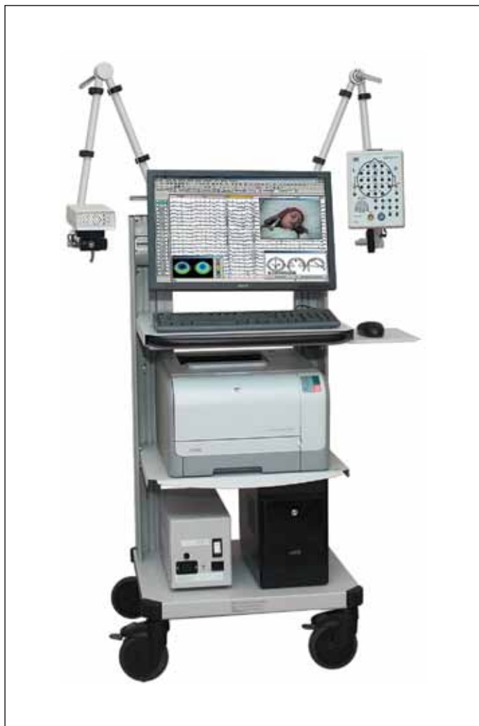
Рис. 7. Электроэнцефалограф Мицар