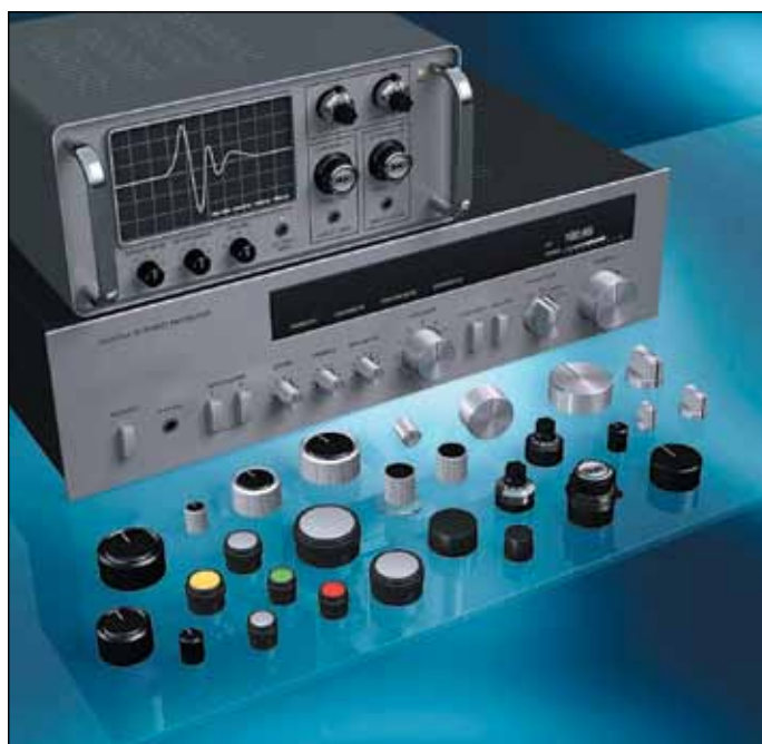
Рис. 2. Регулировочные ручки MENTOR