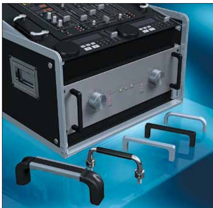
Рис. 1. Приборные ручки фирмы MENTOR

После поглощения компаний Albert Weidmann Licht-Elektronik GmbH