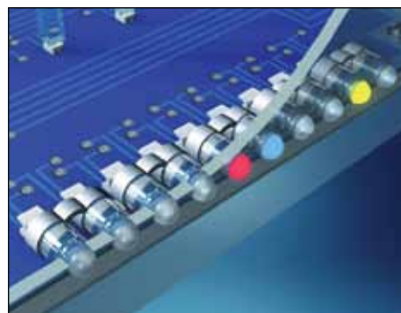
Рис. 4. Гибкие цепочки световодов

Не столь популярная, но и не менее интересная разработка MENTOR GmbH & Co — модульные семисегментные дисплеи с широким диапазоном размеров и возможностью комбинирования разных цветов индикации в одном корпусе (рис. 5). Эта разработка была