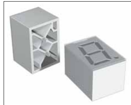
Рис. 5. Семисегментный дисплей MENTOR, серии 2274

и REINHOLD OPTO ELECTRONIC в 1982 г., компания MENTOR открыла новое направление деятельности — производство оптоэлектронных компонентов для промышленного применения, в основном ориентированных на автомобильную отрасль. Фирма является поставщиком готовых решений в области освещения салонов для автомобилей премиум-класса: Audi, BMW, Bentley, Rolls-Royce и Volvo.