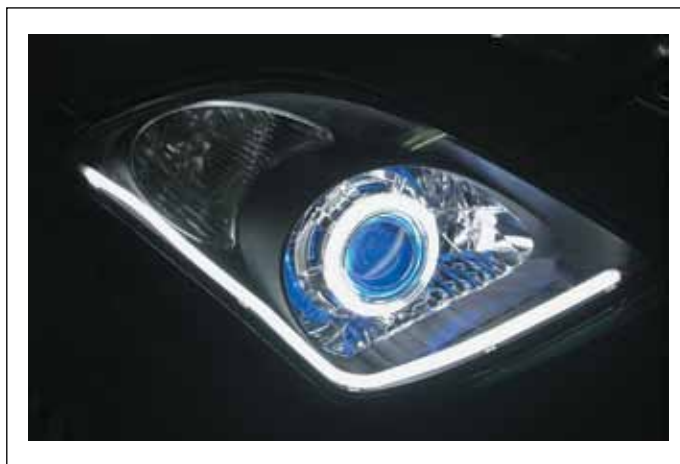
Рис. 10. Модульные системы M-tube

бого назначения, использует в своих изделиях алюминиевые ручки серий 268.5, 3263.20133 из стандартной линейки (рис. 6).