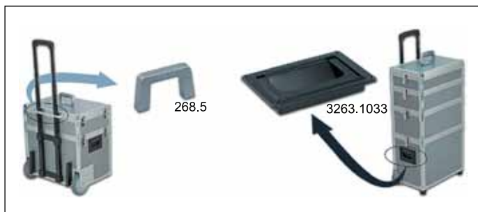
Рис. 6. Применение ручек Mentor в продукции фирмы ККС